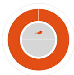
Herkunft der Nachweise

85,88 % Wasserkraft 14,12 % Sonstige erneuerbare Energieträger