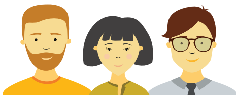
WILLI Einfach INGE Immergrün RAINER Ökostrom

Da deine Stromerzeugung und dein Stromverbrauch nicht immer unmittelbar zeitgleich erfolgen, liefern WIR auch sauberen Naturstrom ins Haus, wenn die Sonne einmal nicht scheint bzw. in der Nacht. Mit den WIR Ökostrom-Tarifen WILLI , INGE , RAINER ist dein gesamter Haushaltsstrom zu 100 % aus ökologischen Quellen gedeckt.